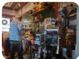
焙煎機と店主。店主の趣味がぎゅつと詰まったおしゃれな店内

何ともいえない香ばしい良い香りがふわっと漂ってくる。入口は段差があり、通路幅も狭め。取材時に、車椅子では入店は難しそうと思った瞬間、「車いすのお客さんやわ」と、常連であろう女性が店主に声をかけてくださり、考えてくださった末、ご自宅の駐車場に机を移動してくださるご配慮も。