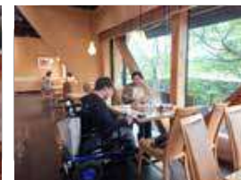
店内も広々としていて、電動車いすでも座りやすいテーブル