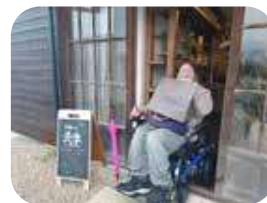
入口は引き戸でフラットなので車いすでもOK