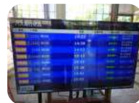
美術館にはバスの運行状況などが表示されたディスプレイも