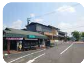
石山寺周辺には飲食店もたくさん