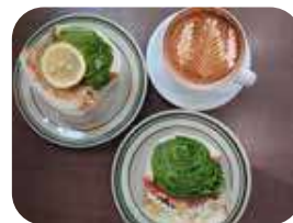
美しい断面。滋賀県の素材にこだわった美味しいサンドイッチ

ドイッチのパンは琵琶湖畔でも食べる時、しんなりしないよう特注で「壺製パン所」に依頼。そのパンの中に草津や滋賀県産の農産物がぎゅっと詰め込まれた目にも鮮やかな商品の数々。「滋賀県民よりも詳しい大阪人」と自ら仰るほど、滋賀が好きなお2人だからこそできるcafeだと心から思えるお店。お店に行くまでの道のりもフラットなので車いすやベビーカーでもアクセスしやすい。