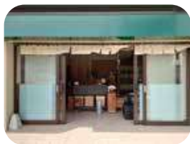
入口もフラットで車いすやベビーカーでも入りやすい