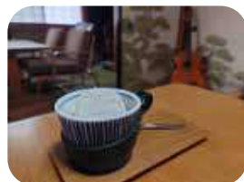
焙煎コーヒーゼリーは香りの高い珈琲をゼリーに。優しいミルクアイスが絶妙にマッチ