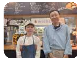
滋賀県が好きすぎて、念願の移住 & お店を構えたご夫婦