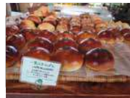
一里山あんばんは実際見てびっくりの大きさ! あんこたっぷり!

空間が広いので、隣の方の存在も気にならず、ゆっくりと飲食できるのも嬉しいところ。パンを購入する通路幅は、狭い箇所もあるものの、車いすやベビーカーで通れる箇所ばかり。入口もフラットで入りやすい。車いすトイレはないものの、ベビーベッドがあったり、子ども用の椅子があったりと、子連れにも優しいお店。