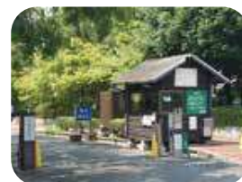
東口の駐車場から入り、警備員さんに言えば、車いすユーザーや足が不自由な方なども図書館や美術館前まで車で入れる

とした、里山の保全活動にも力をいれている為、移ろいゆく季節を堪能できる。春や秋は1日中公園で過ごせる程、居心地のよい場所。図書館の中になるカフェフランキーや日本庭園を眺められる夕照庵なども車いすでも入れるので、ちょっとした休憩にもおすすめ。