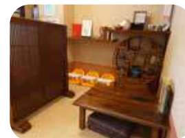
子どもでも入りやすいように座敷あり！