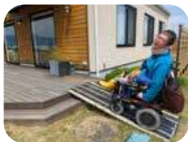
「strawberry factory」は車椅子やベビーカーが通りやすいような板設置あり