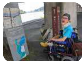
橋の影がいくつかあるので休憩スポットにぴったり