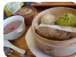
おすすめはせいろ蒸し。食べた後は体がぽかぽか

さんが、中国の留学生との交流があった事が縁となり、食べ物からも気を巡らせる場所を作りたいとこのお店ができたそう。店内は車いすでもスムーズに入店でき、耳の聞こえない人も筆談で対応して下さるなど、臨機応変にその方に合わせた接客をしてくれるのも嬉しいポイント。