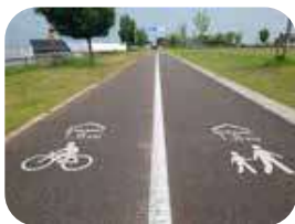
ランニングや自転車などで使える専用通路もあり

PARK」や「蜂蜜いちご」を堪能できる、ドックランが併設された「Strawberry Factory」があり、買い物やカフェなどゆったりとした時間を過ごすことも。また、トイレは各所にあり、特に女子トイレは個室が広いので、子連れでも入りやすい。また、身障者用トイレやオストメイトを完備してある箇所もあるので安心。