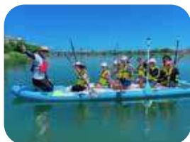
8人も乗れるBIGSUPも大人気！（インストラクター付貸切2h ¥24,800～）